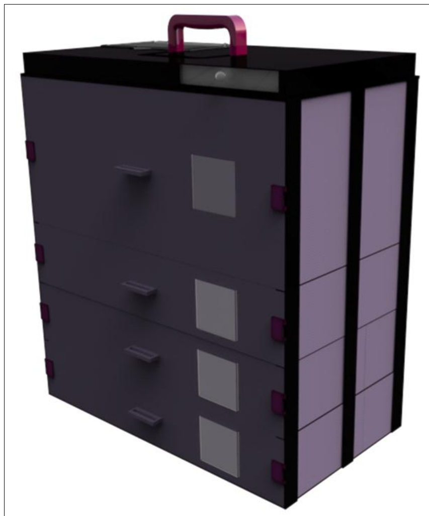
شکل ۱: نمایی از جعبه طراحی‌شده برای اسکلت انسانی

نیاز به چند ابزار مختلف دخیل در بسته‌بندی است، می‌تواند کاملاً توجیه‌پذیر باشد که با تولید انبوه قاعدتاً قیمت نهایی نیز کمتر خواهد بود. مواد پیشنهادی برای ساخت این طرح می‌تواند مواد پلی‌استری برای بخش خارجی، و برای بخش داخلی آمیزه‌ای از اسفنج‌های پلی‌اورتانی به همراه روکش پلی‌استری باشد که علی‌رغم سبک و مقاوم بودن، ماندگاری بالای محصول نهایی را نیز در پی دارد. همچنین این طرح، با توجه به امکان استفاده از آن، از زمان کشف آثار تا حمل‌ونقل، ذخیره و امکان دسترسی جهت‌دار به بخش‌های مختلف استخوانی به صورت کلی و مجزا، می‌تواند توجیه‌های اقتصادی و کاربردی مناسبی را نشان دهد. از طرفی