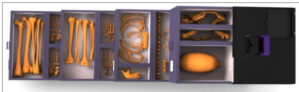
شکل ۳: نمای بالا از جعبه مورد طراحی برای اسکلت انسانی Fig. 3: Interior of the designed box