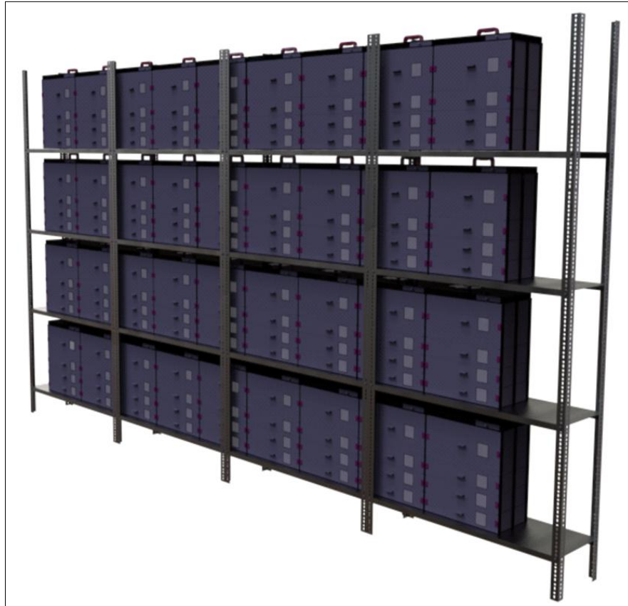
شکل ۴: نمایی از نحوه قرارگیری جعبه‌های مورد طراحی برای اسکلت انسانی در مخازن موزه‌ها Fig. 4: Putting boxes in museum tanks